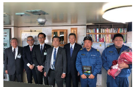
北九州港／歓迎セレモニー