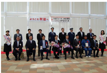
秋田港／歓迎セレモニー