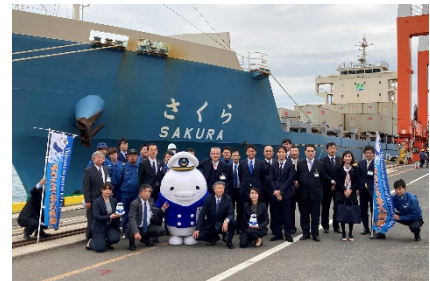
北九州港／記念撮影の様子