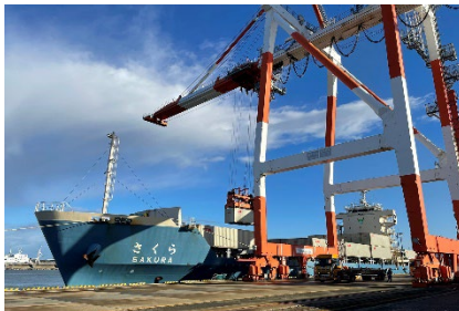
秋田港／荷役中の「さくら」

※ 神戸－ひびき間は弊社既存内航コンテナ船ネットワークを利用した速やかなトランシップサービスを実施いたします。