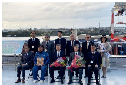
新潟港／歓迎セレモニー